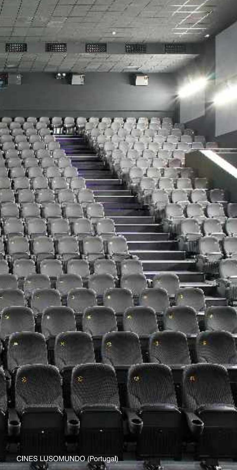
CINES LUSOMUNDO (Portugal)