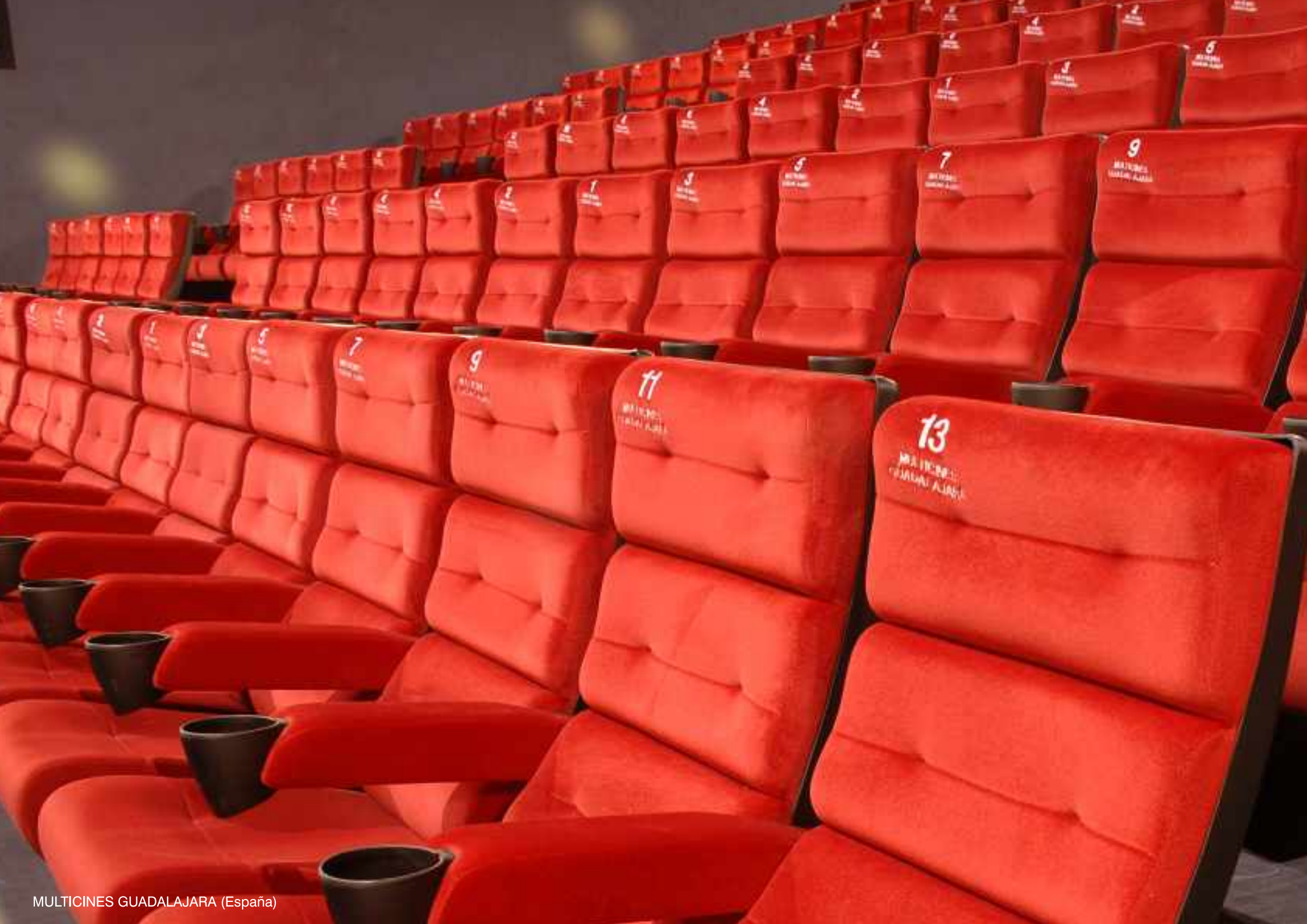
MULTICINES GUADALAJARA (España)