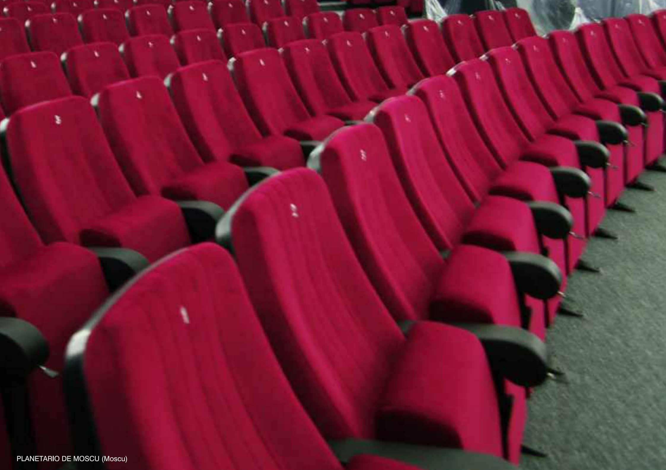
PLANETARIO DE MOSCU (Moscu)