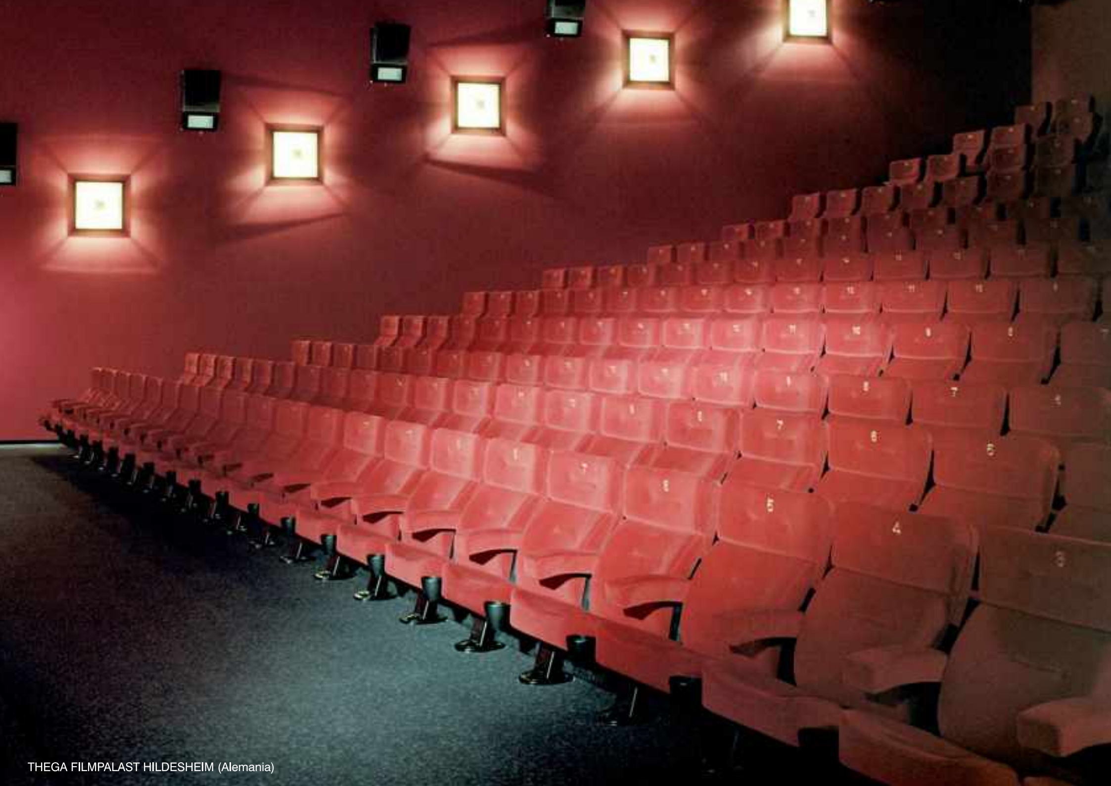
THEGA FILMPALAST HILDESHEIM (Alemania)